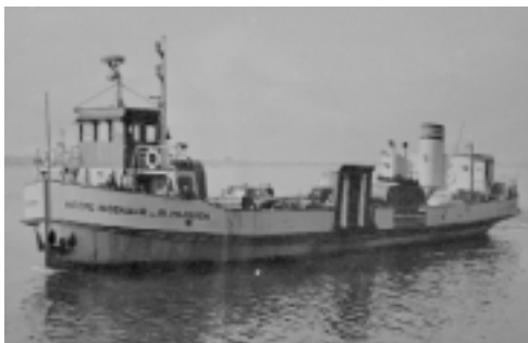
Veerboot 'Hoofdingenieur van Elzelingen'. In 1954 werd de boot voorzien van een radarinstallatie.

Andere boten waren de 'Notaris van den Blink', de 'Coppelstock', de 'Prinses Irene', en vooral de 'Hoofdingenieur van Elzelingen' die vrij lang als veerboot dienst gedaan heeft.