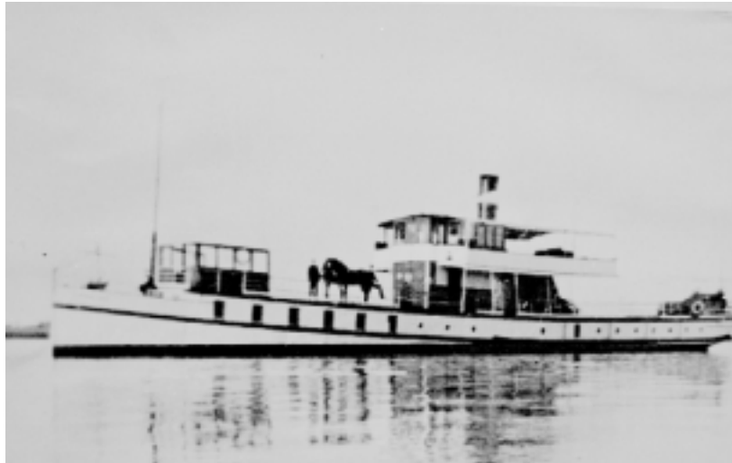
Stoomschip 'Harmonie I', lengte 43,63 m, breedte 6,82 m, laadvermogen 70 ton, machinevermogen 250 PK.

Van het stoomschip 'Harmonie I' is niet veel meer bekend dan dat het voor het laatst omstreeks 1935 in het veer Brielle - Rozenburg dienst deed.