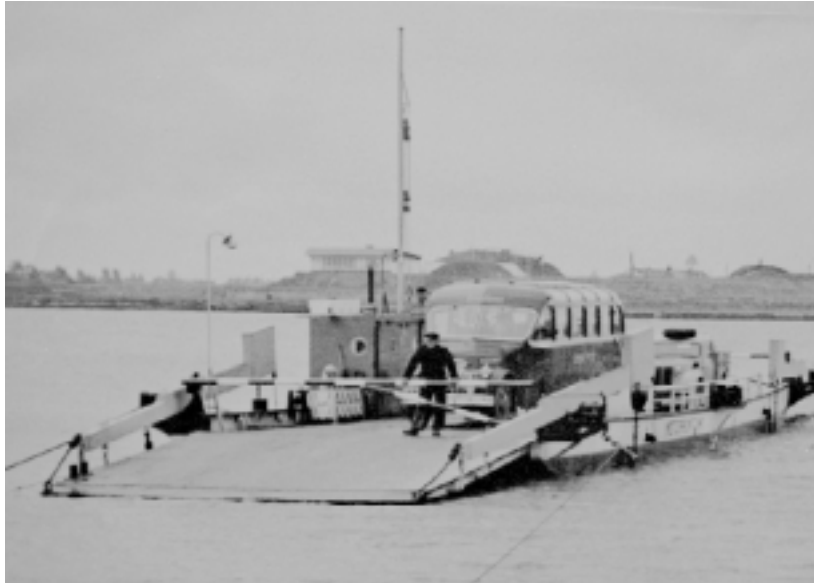
Kabelveerpont Brielle - Rozenburg

Met de afdamming van de Brielse Maas medio 1950 werd duidelijk, dat voor de verbinding Brielle - Rozenburg geen zeewaardige schepen meer vereist waren. Op beide oevers werden nieuwe veerstoepen gebouwd, en er werd een opdracht voor de bouw van een kabelveerpont verstrekt. In januari 1952 werd de pont in bedrijf gesteld. De kosten voor de bouw waren geraamd op f 98.500.-, het afrekenbedrag was f 106.340.-. Bij de bouw was rekening gehouden met de verwachting, dat er binnen ongeveer tien jaar een vaste oeververbinding over de Brielse Maas - nu het Brielse Meer zou komen.